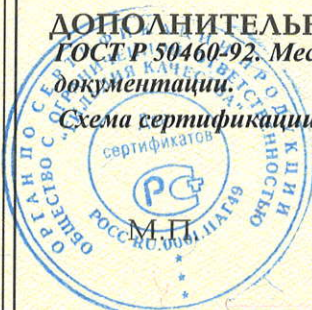
Схема сертификации № 3

ДОПОЛНИТЕЛЬНАЯ ИНФОРМАЦИЯ Маркировка продукции знаком соответствия производится по ГОСТ Р 50460-92. Место нанесения знака соответствия - на изделии и (или) на упаковке и в сопроводительной документации.