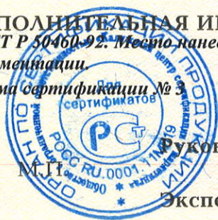
Схема сертификации № 3

ДОПОЛНИТЕЛЬНАЯ ИНФОРМАЦИЯ Маркировка продукции знаком соответствия производится по ГОСТ Р 50460-92. Место нанесения знака соответствия - на изделии и (или) на упаковке и в сопроводительной документации.