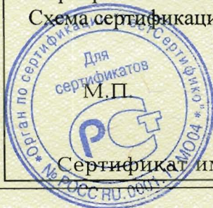
Схема сертификации: 3.

Маркирование знаком соответствия по ГОСТ Р 50460-92.