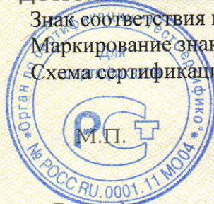
Схема сертификации: 3.

Руководитель органа (заместитель руководителя)