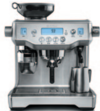
КОФЕЙНАЯ СТАНЦИЯ C805