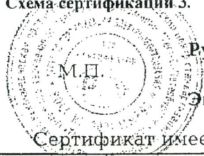
Схема сертификации З.

Институт испытаний и сертификации VDE (Merianstrasse 28, D-63069 Offenbach, Germany): отчёт испытаний № 263300-2570-0118/83132 от 01.03.2007. Место нанесения знака соответствия: на изделии, на таре (упаковке), на сопроводительной технической документации