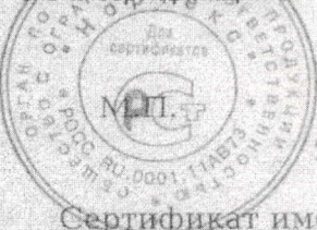
Схема сертификации З.

Маркировка продукции знаком соответствия производится по ГОСТ Р 50460-92. Место нанесения знака соответствия на упаковке и в сопроводительной документации.