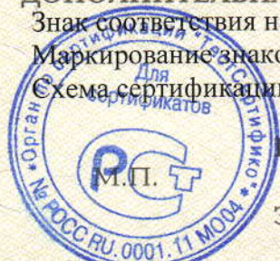
Схема сертификации: 3.

Маркирование знаком соответствия по ГОСТ Р 50460-92.