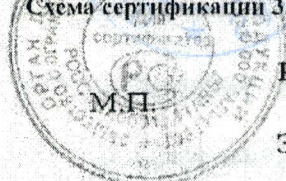
Схема сертификации З.

ДОПОЛНИТЕЛЬНАЯ ИНФОРМАЦИЯ Знак соответствия наносится на упаковке рядом с наименованием изготовителя и в товаро-сопроводительной документации. Форма и размеры знака по ГОСТ Р 50460-92. Часть продукции промаркирована знаками РСТ АЯ46, АЕ95.