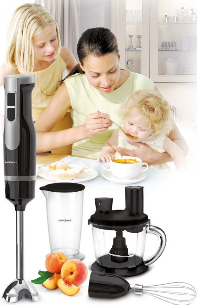
Electric blender/Блендер электрический RMB-2601 Instruction manual/Инструкция по эксплуатации