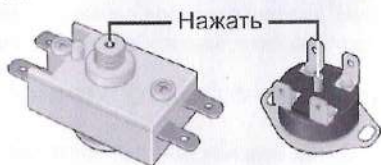
Рисунок 3. Схема расположения кнопки термовыключателя

Вышеперечисленные неисправности не являются дефектами ЭВН и устраняются потребителем самостоятельно или за его счет.