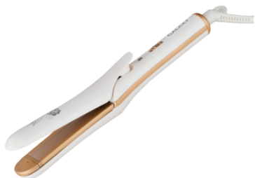
GL4502 ЩИПЦЫ ДЛЯ ВОЛОС