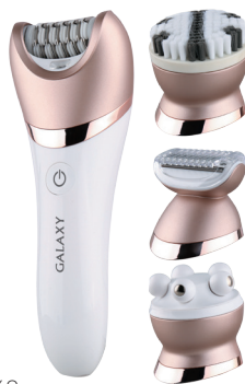
GL4960 ПРИБОР ДЛЯ УХОДА ЗА КОЖЕЙ