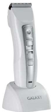
GL4153 НАБОР ДЛЯ СТРИЖКИ АККУМУЛЯТОРНЫЙ